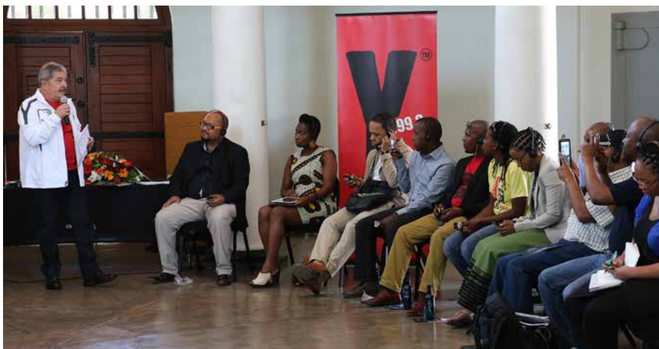
Ex-presidente Lula conversa com jovens sul-africanos na Fundação Steve Biko.