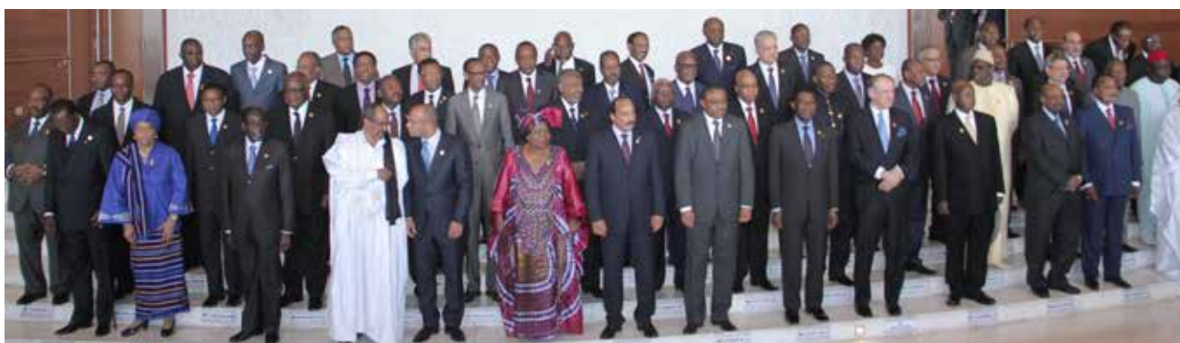
Nkosazana Dlamini-Zuma, presidenta da União Africana e Chefes de Estado e Governo africanos durante a conferência.

Atividade: participação de Celso Marcondes como observador.