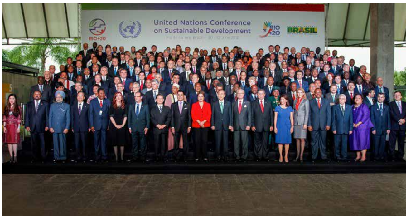
Presidenta Dilma Rousseff e 193 representantes de Estados-membros da ONU durante a conferência.

Organização: Governo Federal e Organização das Nações Unidas (ONU).