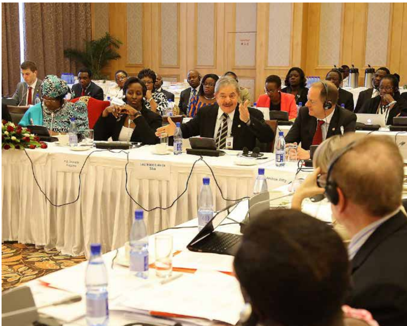
Joyce Banda, então presidenta do Malawi, Jeannette Kagame, primeira-dama de Ruanda, ex-presidente Lula e Andrew Witty, CEO da farmacêutica GlaxoSmithKline e chanceler da Universidade de Nottingham durante o evento.

Organização: UNAIDS (Programa Conjunto das Nações Unidas sobre HIV/Aids)