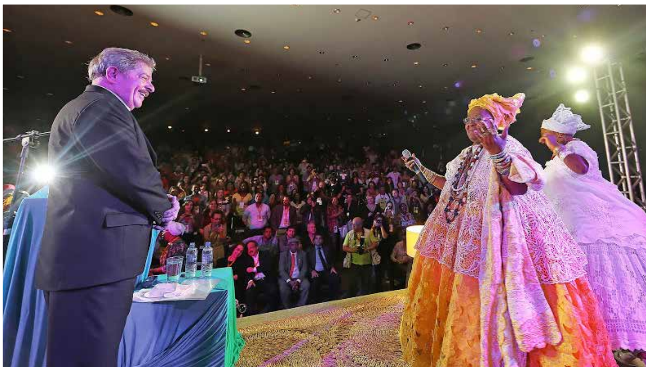
Ex-presidente Lula e a Yalorixá Railda, durante o cortejo do Ilê Axé Oya Bagan no evento.