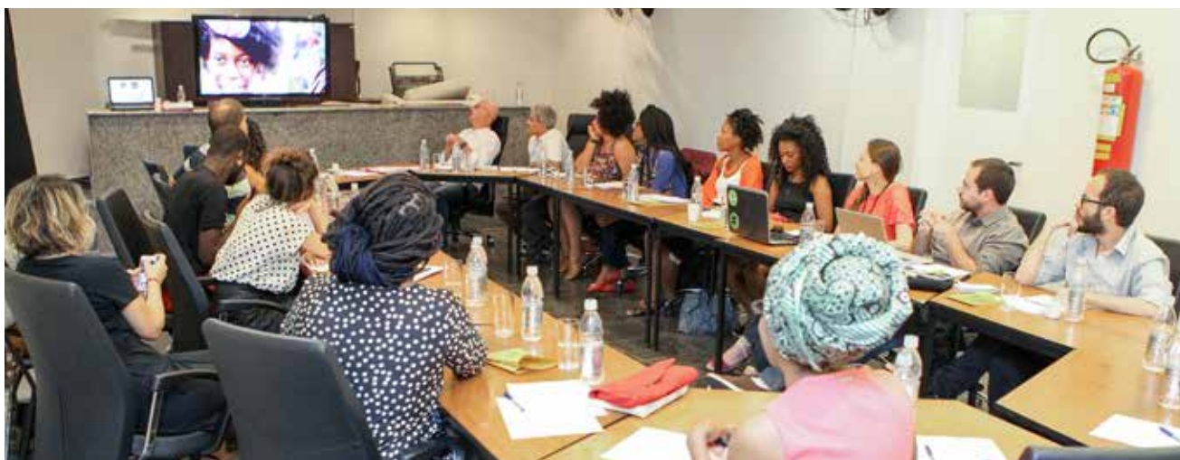
Apresentação das novas mídias negras no “Conversas sobre África IX: Os Movimentos Sociais e o crescimento das mídias afro-brasileiras”

Seminário “Conversas sobre África IX: Os Movimentos Sociais e o crescimento das mídias afro-brasileiras” , com representantes de mídias negras e alternativas (Empoderadas, SambaSampa, Grupo de Refugiados e Imigrantes Sem Teto de São Paulo-GRIST, Opera Mundi, Sindicato dos Jornalistas, Que Nega É Essa?, CartaCapital, CEERT e Movimento Contra a Maioridade Penal: #15contra16).