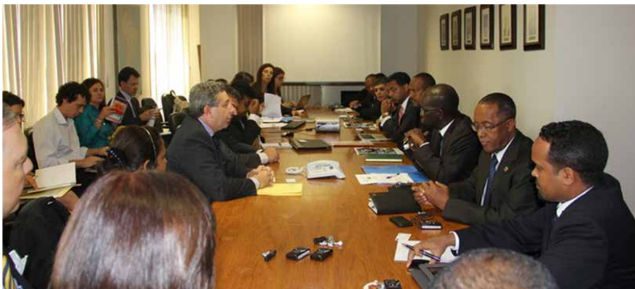
Delegação etíope em Brasília

Organização: Programa Mundial de Alimentos (PMA), da Organização das Nações Unidas (ONU)