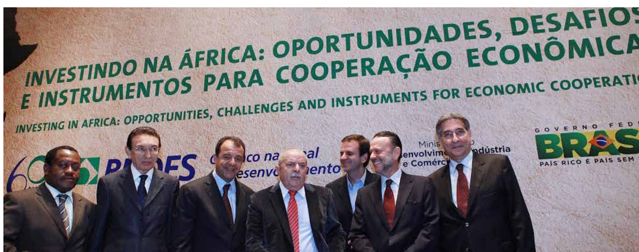
Thomas Sukutai Bvuma, decano do Corpo Diplomático da África no Brasil embaixador da República do Zimbábue, Edison Lobão, ministro de Minas e Energia, Sérgio Cabral, governador do Estado do Rio de Janeiro, ex-presidente Lula, Eduardo Paes, prefeito do Município do Rio de Janeiro; Luciano Coutinho, presidente do BNDES e Fernando Pimentel, ministro do Desenvolvimento, Indústria e Comércio Exterior

Organização: Banco Nacional de Desenvolvimento Econômico e Social (BNDES)