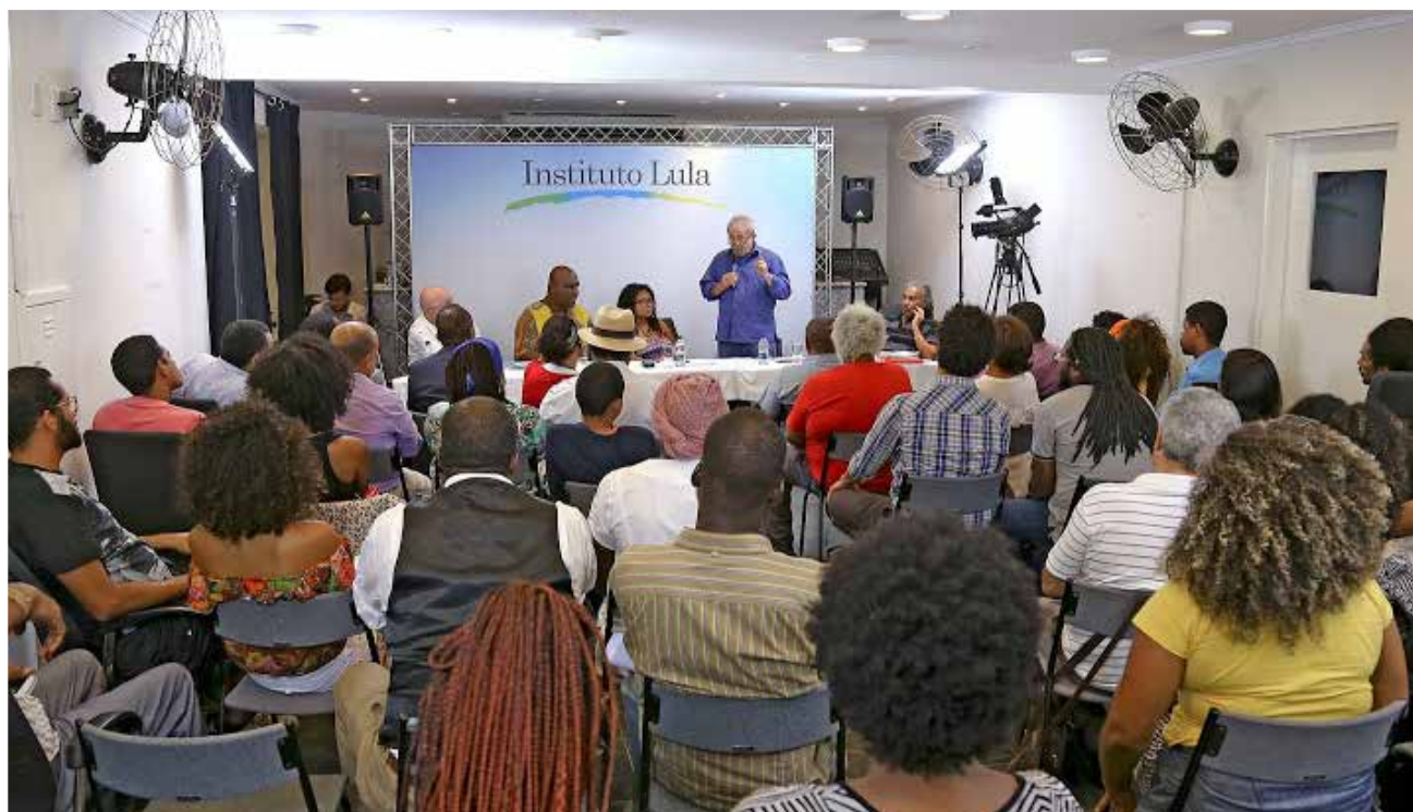
Ex-presidente Lula em discurso para as lideranças do Movimento Negro durante o encontro.

Encontro do ex-presidente Lula com o Movimento Negro , com representantes da Coordenação de Entidades Negras (CONEN), Núcleo Impulsor da Marcha das Mulheres Negras de São Paulo, do Movimento Negro Unificado, Coletivo Dandariano e mais 25 entidades.