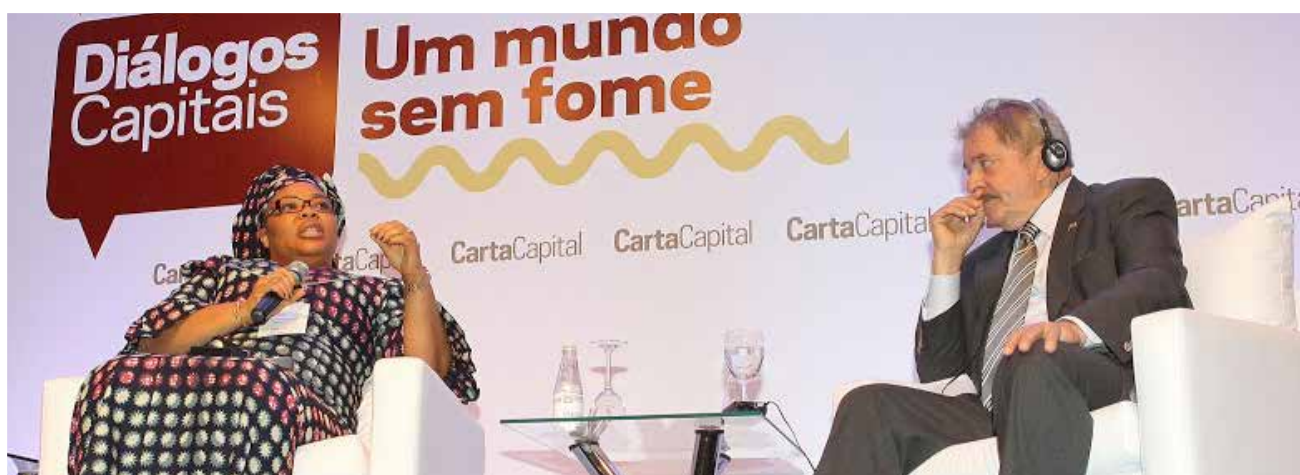
Ex-presidente Lula e Leymah Gbowee ativista da Libéria e Prêmio Nobel da Paz 2011.