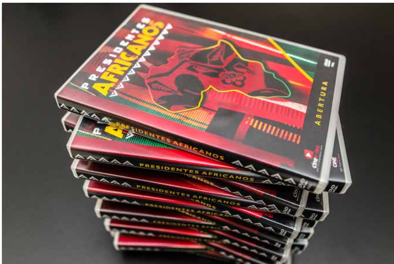
Série de documentários Presidentes Africanos

Organização: em parceria com os sindicatos dos Bancários de São Paulo e Metalúrgicos do ABC.