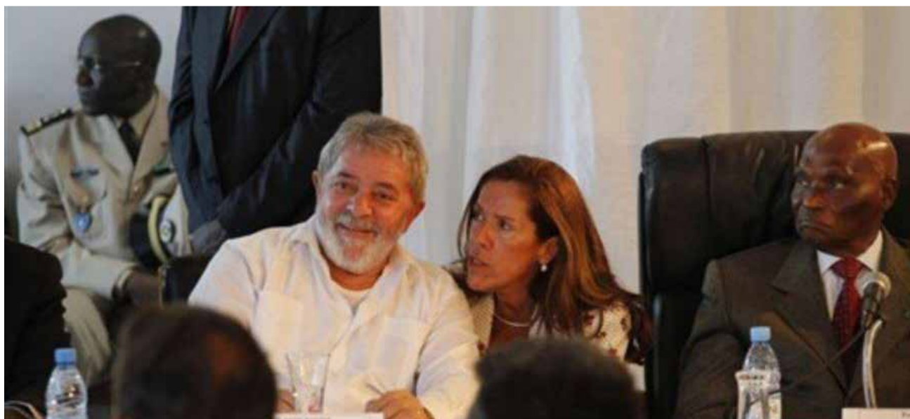
Ex-presidente Lula e Abdoulaye Wade, então presidente do Senegal durante o 11º Fórum Social Mundial

Organização: Comitê Organizador do FSM e movimentos sociais.