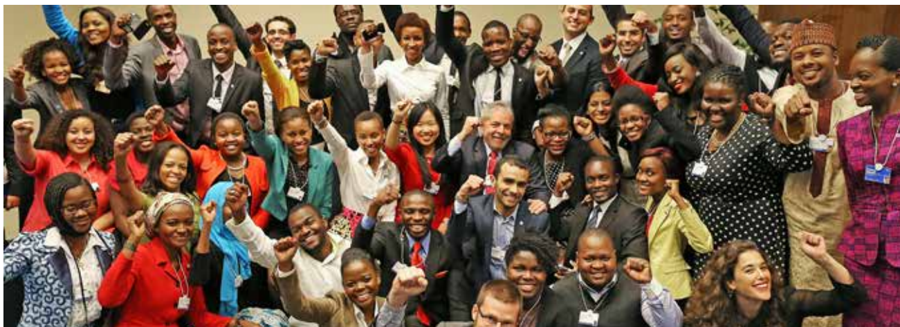
Ex-presidente Lula com jovens africanos no evento “Conheça o Líder”