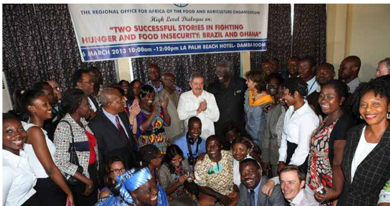
Ex-presidente Lula ao centro e o ex-presidente John Kufuor à sua esquerda com representantes da FAO e participantes do evento

Organização: Organização das Nações Unidas para Alimentação e Agricultura (FAO)