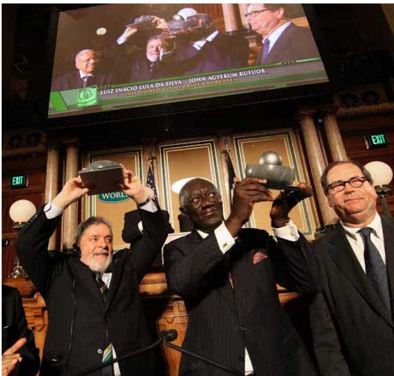
Ex-presidente Lula e John Kufuor com o prêmio World Food Prize 2011

Organização: World Food Prize Foundation